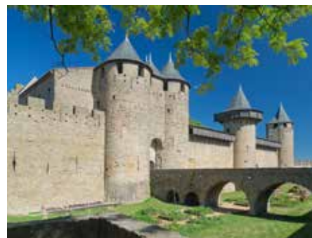
コンタル城と内側の城壁 12世紀

シテ最後の砦であるコンタル城はカルカソンヌ子爵トランカベル家により12世紀に建造されました。考古学博物館併設。お城の周りの城壁および内側の城壁の一部はコンタル城よりアクセス可。