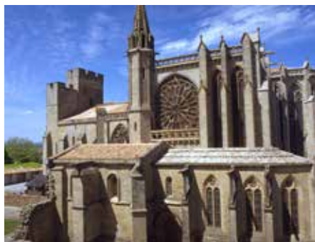
サンナゼール・バジリカ 11世紀、14世紀

ロマネスク様式とゴシック様式の見事なハーモニーを織りなす『シテの宝石』とされる教会です。南フランスで最も美しいと言われるステンドグラスをご覧いただけます。