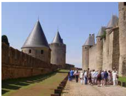
外側の城壁と二つの城壁の間

シテを囲む4世紀の内側の城壁と13世紀の外側の城壁の間の空間はリス(矢来)と呼ばれています。1.5Kmの散歩道になっており、52の塔、シテの入り口であるナルボンヌ門やオード門などを見ることができます。